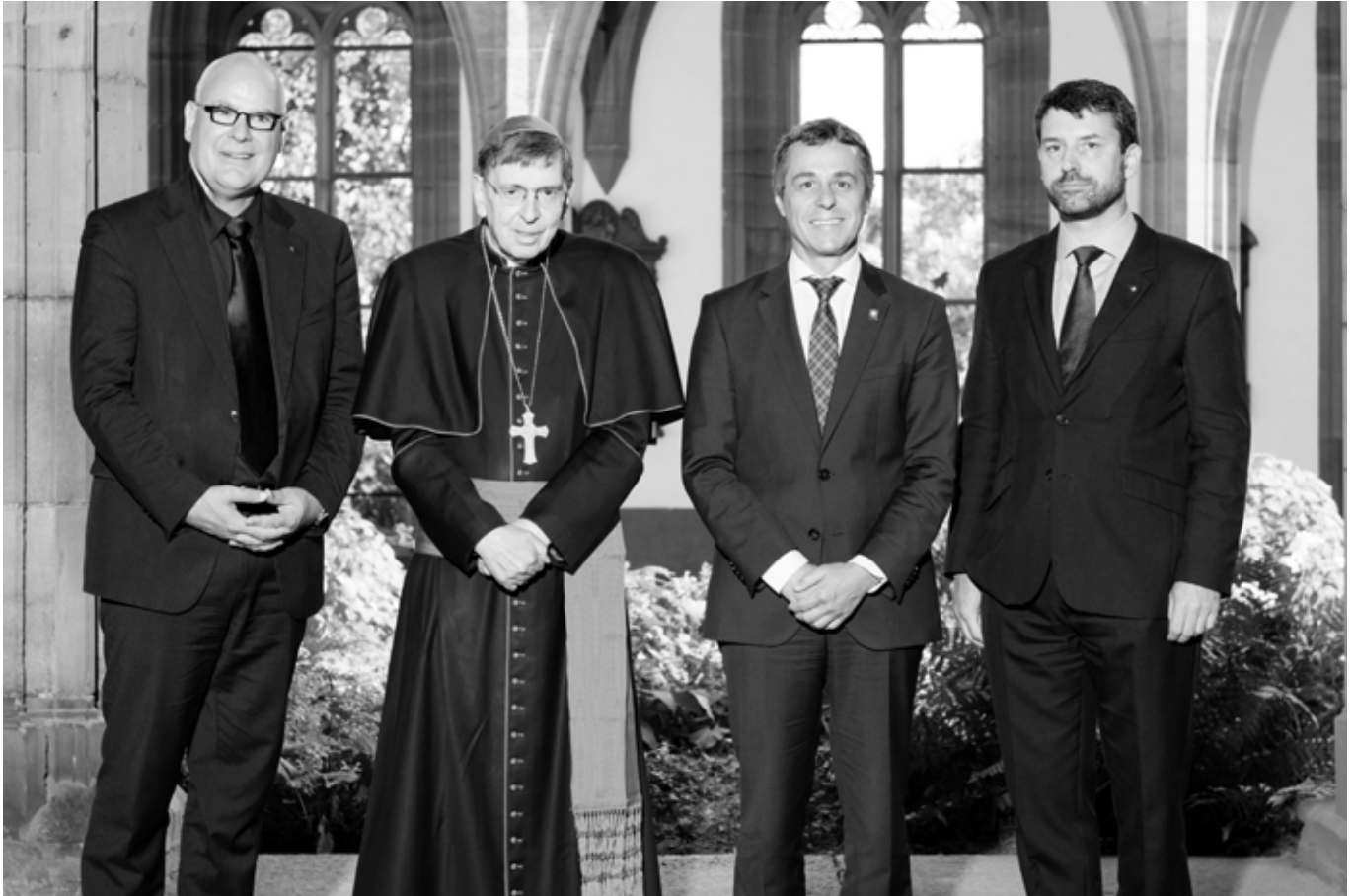
Kirchenratspräsident Pfr. Lukas Kundert, Kurt Kardinal Koch, Bundesrat Ignazio Cassis und SEK-Präsident Gottfried Locher (vlnr.)

Nach dem Europäischen Jugendtreffen von Taizé zu Beginn des Jahres stand die Basler Kirche im September wieder im Fokus von Europa: Im Münster tagte das «evangelische Konzil», die Vollversammlung der Gemeinschaft Evangelischer Kirchen Europas (GEKE).