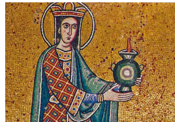
Santa Maria in Trastevere, Fassade, ein kluges Mädchen (aus dem Gleichnis, Mt. 25)

Der erste Abend widmet sich der «Genesis» (Beginn Teil 2): Einführung Hans-Adam Ritter mit einer Zusammenfassung von Matthäus 1–7 (besprochen in der 1. Hälfte 2023), Ausblick auf Teil 2 und 3. Der Ablauf der weiteren Abende sieht wie folgt aus: Zusammenfassung, Klärung der aufgeworfenen Fragen, Kurzeinführung ins Thema, lesen in Kleingruppen. Die Lektüreabende können auch einzeln besucht werden.