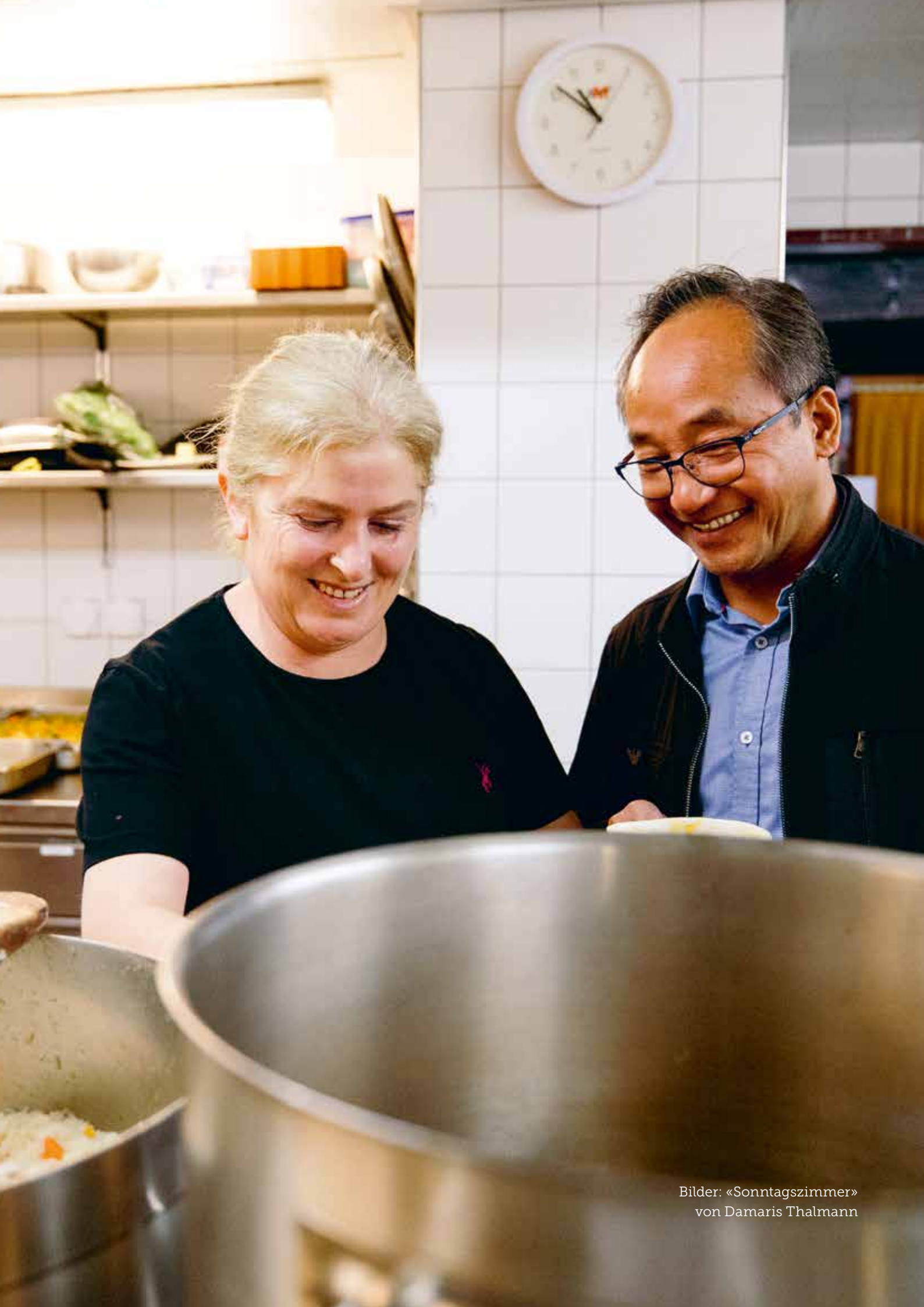
Bilder: «Sonntagszimmer» von Damaris Thalmann