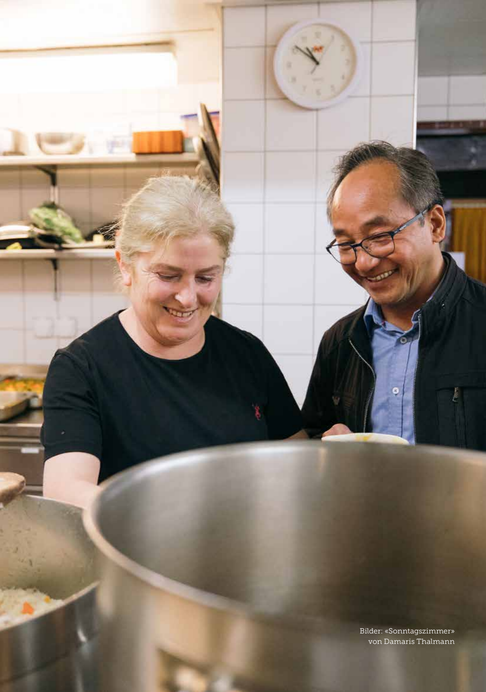
Bilder: «Sonntagszimmer» von Damaris Thalmann