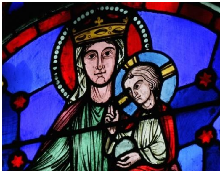
Détail du cœur de la rose Ouest

Pour les premiers rayons de lumière matinale Et les premiers contours du jour Grâce te soit rendue, O Dieu ! Pour les couleurs terrestres que dessine le soleil Sa luminosité perçant les nuages les plus sombres Et ses reflets sur les feuillages et les eaux Grâce te soit rendue ! Montre-moi aujourd'hui Au milieu des traces sombres de la vie, du mal et de la souffrance la lumière qui soutient chacun ! Ecarte les confusions qui embrouillent mon âme Que par ta grâce mon regard soit pur Que je puisse voir et regarder chacun Avec des yeux rincés par la lumière de ce jour nouveau !