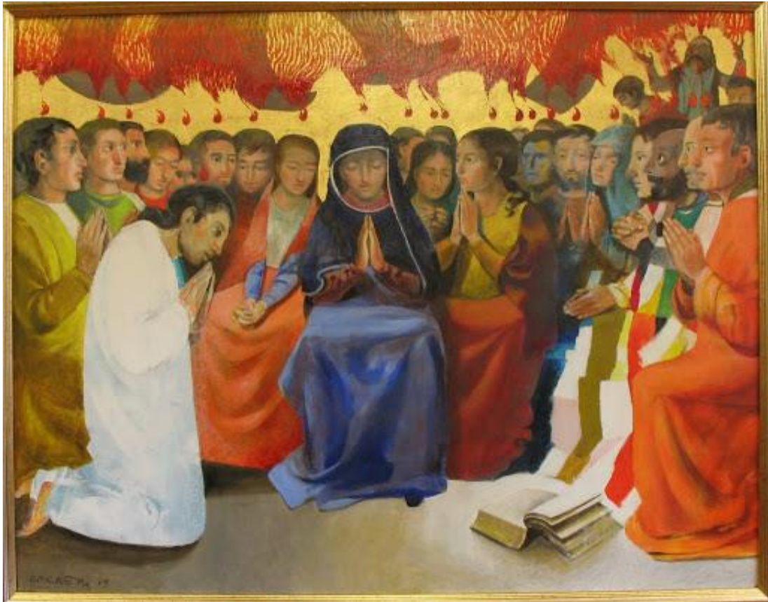
Arcabas – Pentecôte, église du Cénacle de Lyon