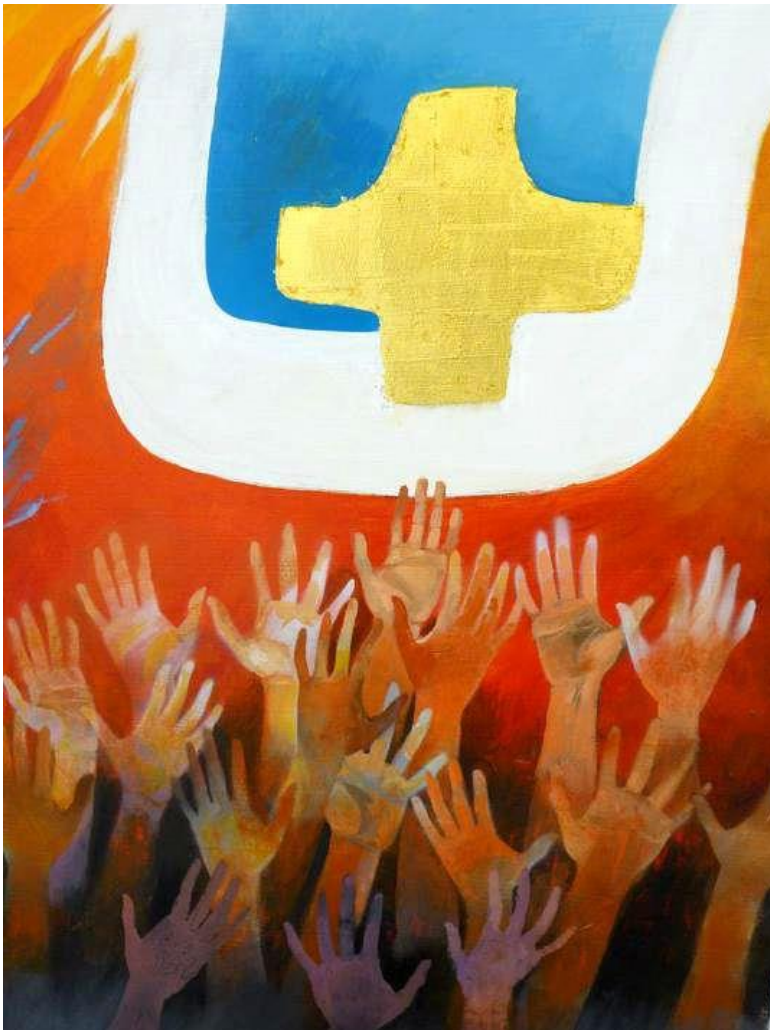
Arcabas – Ascension, tableau exposé au Sanctuaire de Scherpen-Heuvel en Belgique

« Jésus fut élevé vers le ciel pendant que tous le regardaient ; puis une nuée le cacha à leurs yeux. » (Actes des Apôtres 1, 9)