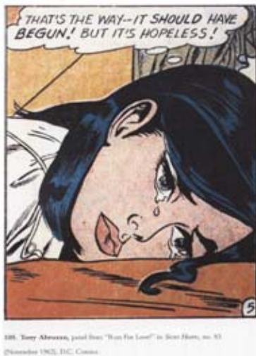
188. Tony Abatemarco, panel from "Run For Love" in Sacred Hearts , no. 53 © November 1962, D.C. Comics

Grösse verkleinert, ist noch zu sehen, wie Lichtenstein arbeitet. Es genügen die vier Grundfarben Schwarz, Gelb, Rot und Blau, die in kleinen Punkten in verschiedener Anzahl und Dichte gedruckt werden, um sämtliche Farben abzubilden. Lichtenstein habe damit die formalen Aspekte betont. Seine Kunst sollte die Künstlichkeit, Banalität und Leere der zeitgenössischen kapitalistischen Kultur in Amerika vor Augen führen und kommentieren.