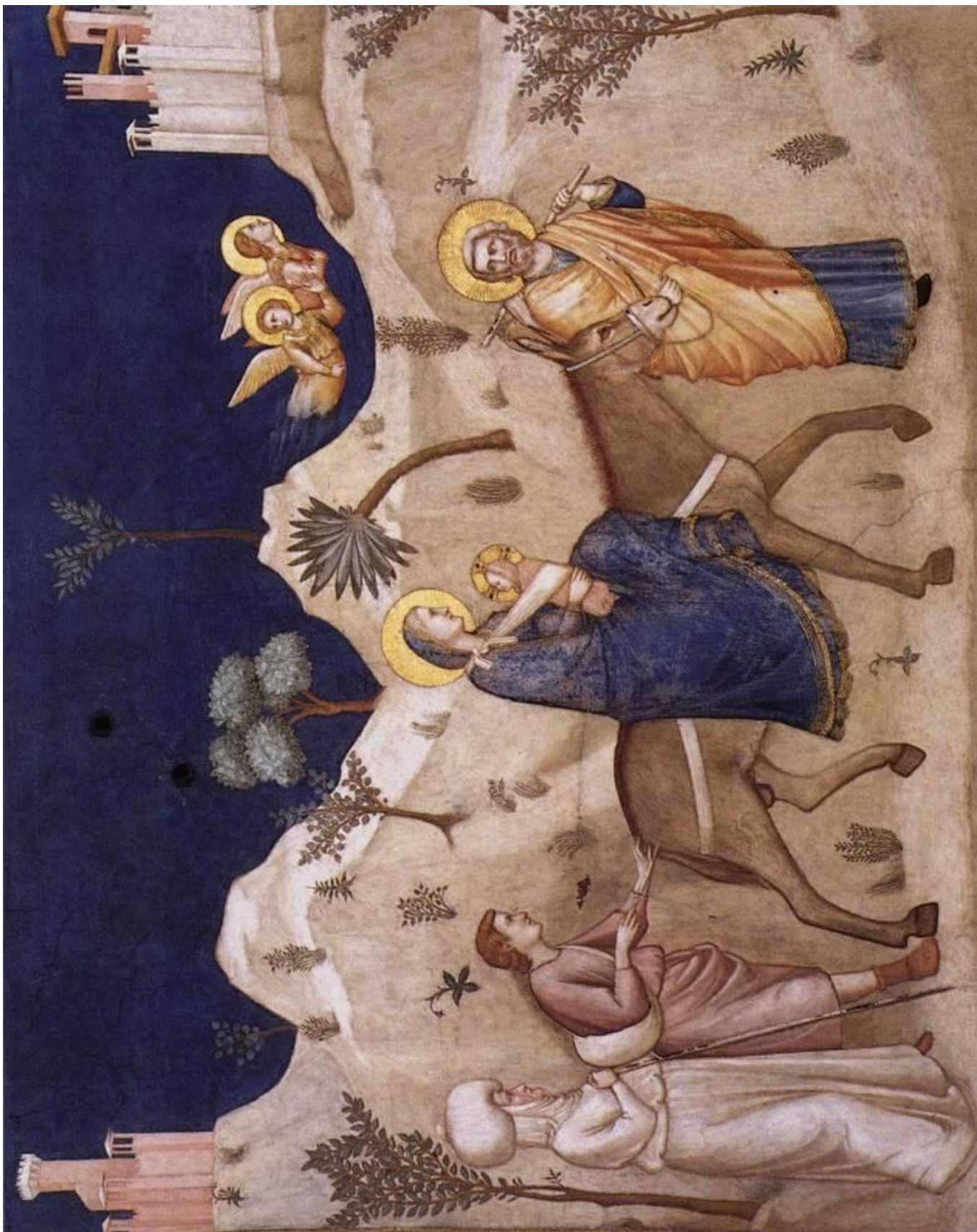
Giotto (1266-1337) : « Fuite en Egypte » (fresque), basilique Saint-François, Assise