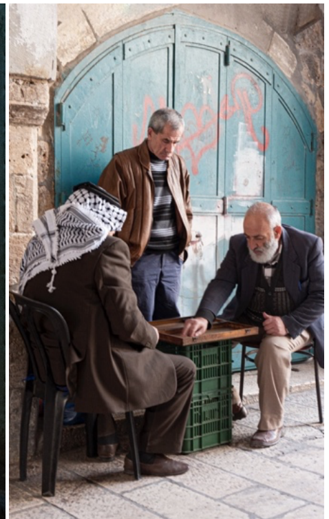
Aus: Lukas Landmann «Jerusalem: Faces of a City» Schwabe Verlag Fotos © Lukas Landmann

Musikalische Meditationen Literarische Betrachtungen Liturgische Feiern