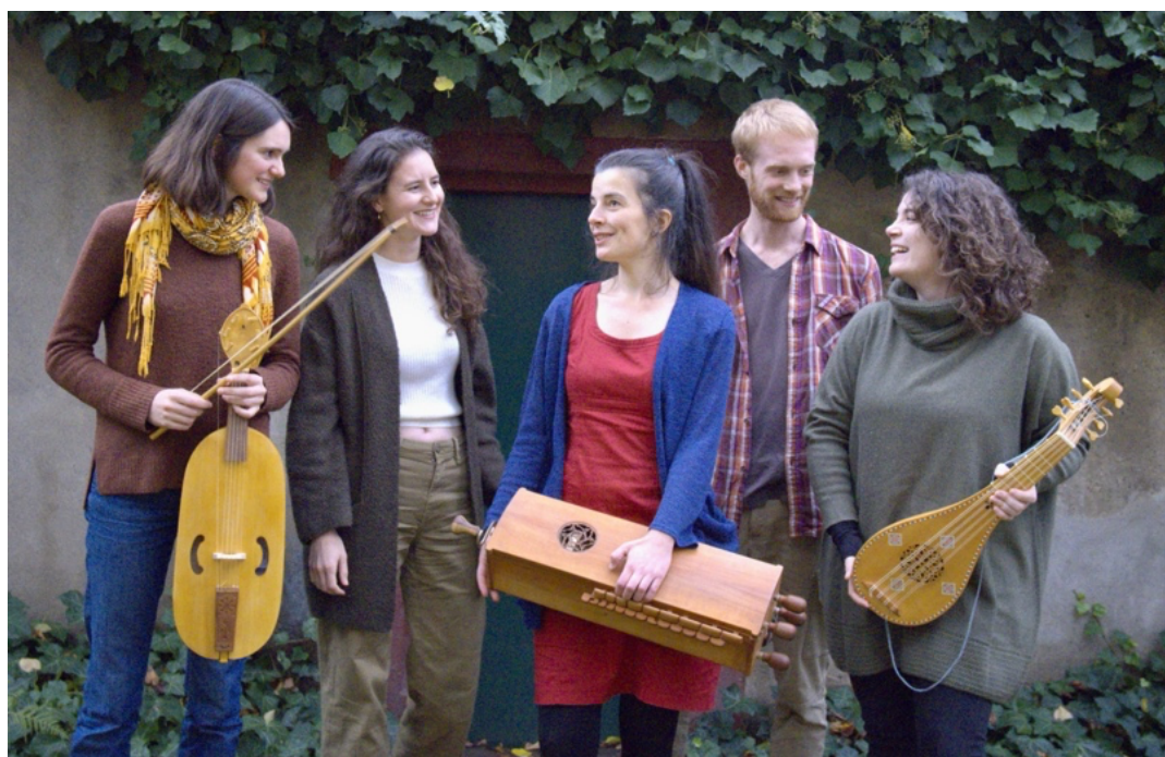
Ensemble «Olla Vogala»