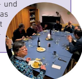
Bilder & Texte (wo nicht anders vermerkt): Mitarbeiter:innen der Kirchgemeinde Gundeldingen-Bruderholz