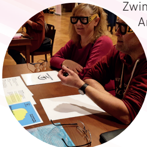
Bilder & Texte (wo nicht anders vermerkt): Mitarbeiter:innen der Kirchgemeinde Gundeldingen-Bruderholz