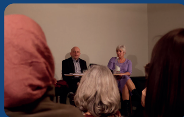
Woche der Religionen: Vom guten Umgang mit Geld