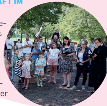
Bilder & Texte: Mitarbeiter:innen der Kirchgemeinde Gundendingen-Bruderholz