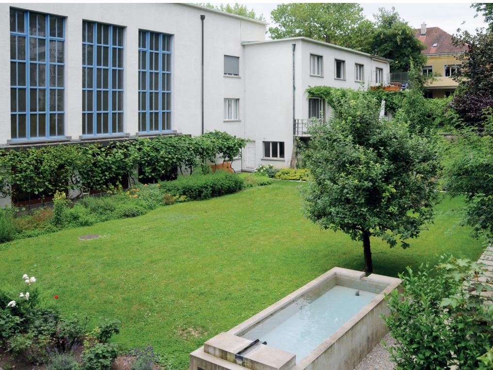
Garten mit Brunnen