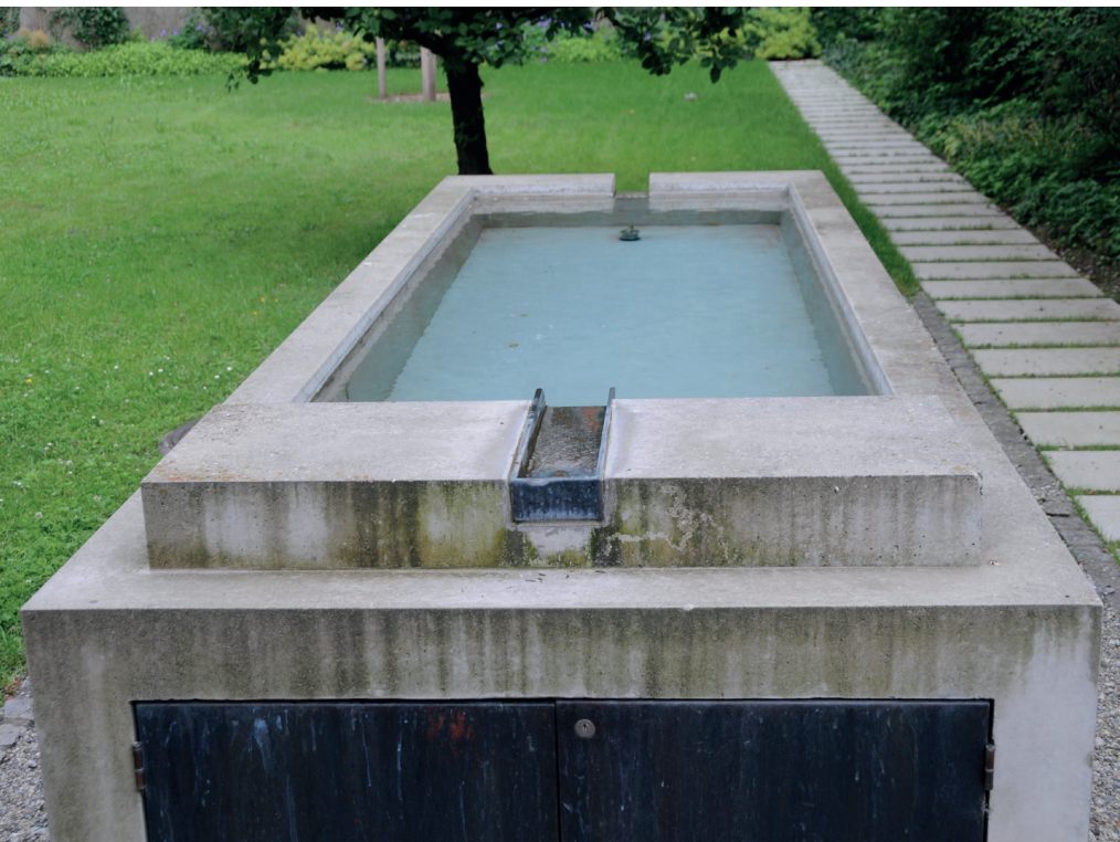
Brunnen mit Quellwasser