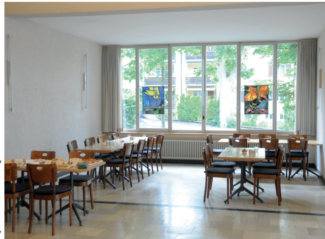
Foyer mit Bistrobestuhlung

Ausstattung: Bestuhlung und technische Einrichtung nach Bedarf, WLAN; Durchreiche zur Küche kann geöffnet werden; Flügel (Steinway), Truhenorgel (optional).