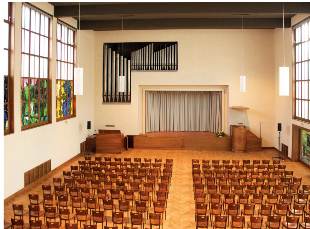
Restaurierter Kirchensaal, Blick Richtung Orgel, Bühne und Kanzel

In 15 Meter Tiefe im Abhang des Bruderholzes entspringen unterirdische Quellen, die zur Zeit des Ersten Weltkriegs in einem rund 135 Meter langen, begehbaren Stollen gefasst wurden. Der Stollenbau verminderte die Gefahr von Hangrutschungen. Als der Stollen saniert werden musste, erbaute die Kirchgemeinde im Garten den Brunnen, um das Quellwasser an die Oberfläche zu holen.