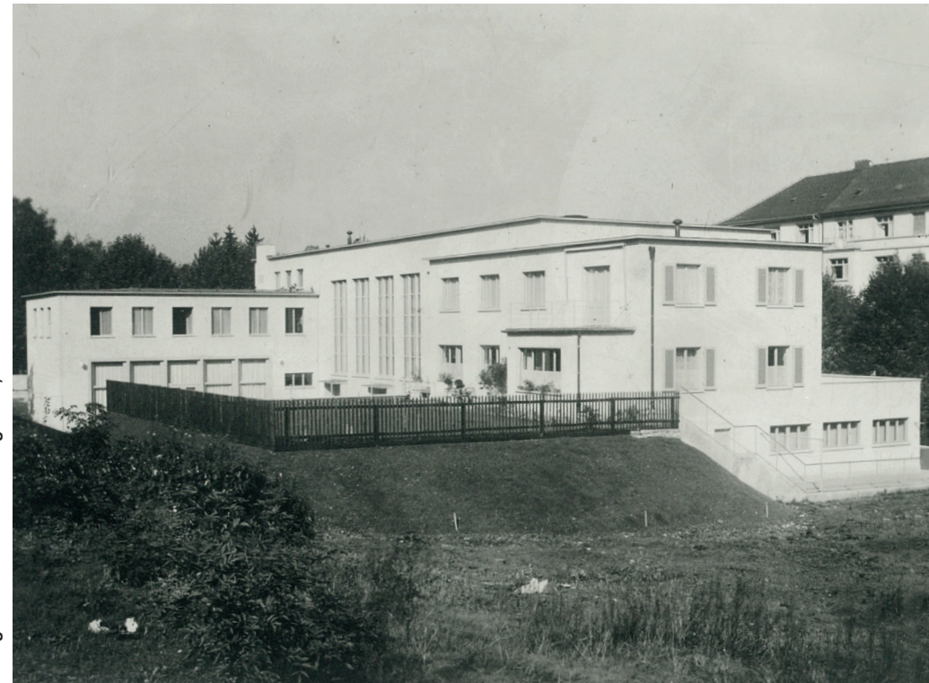
Zwinglihaus vor der Eröffnung 1932, Blick von Südosten

Herausgeber: Andreas Möri Gestaltung: timbers visuelle kommunikation Druck: bc medien ag Auflage: 2023