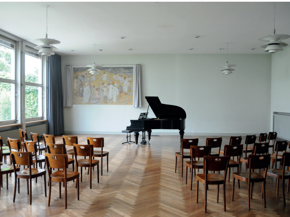
Kleiner Saal mit Flügel