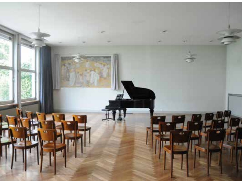
Kleiner Saal mit Flügel