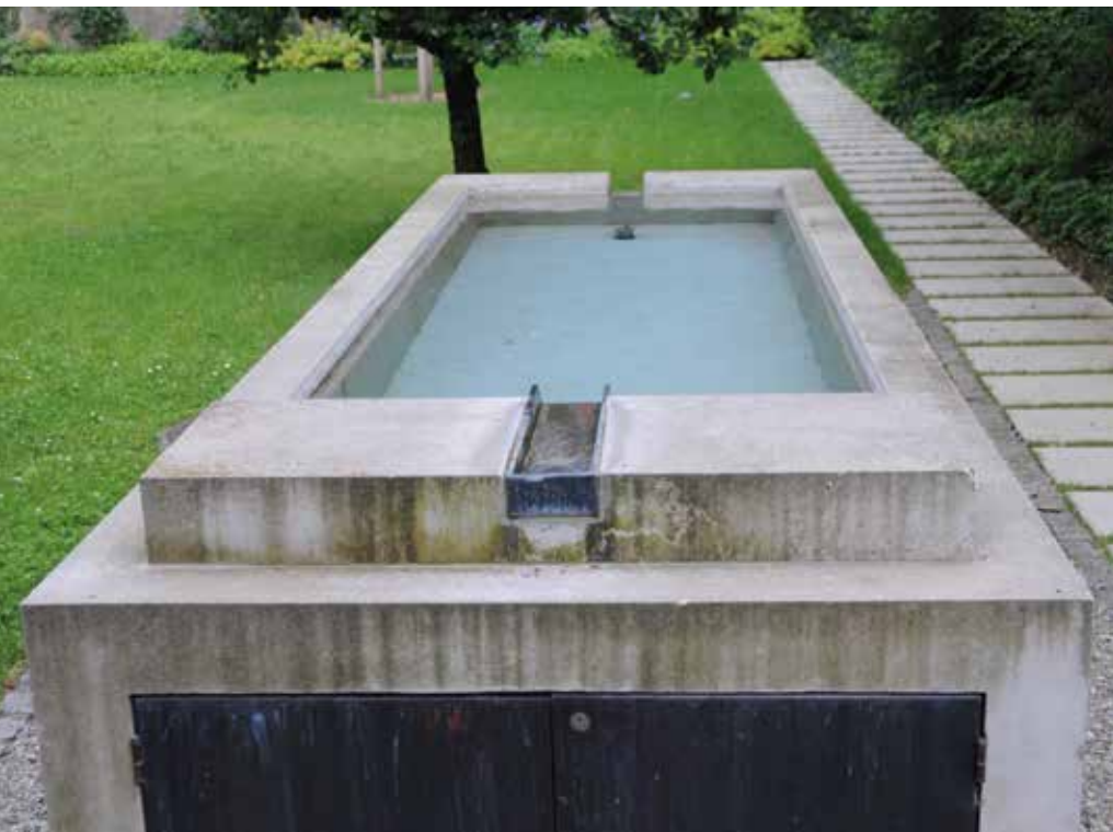
Brunnen mit Quellwasser