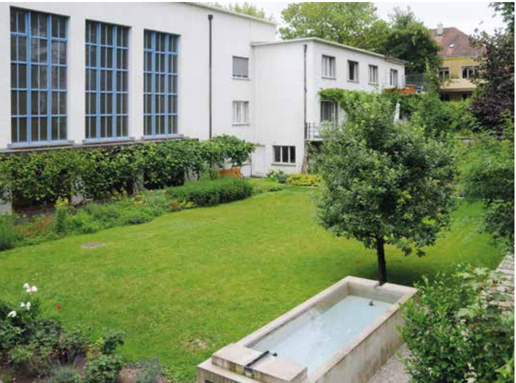
Garten mit Brunnen