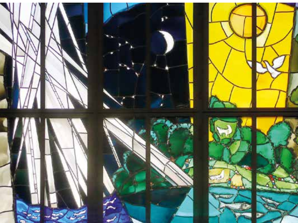
Glasmalerei von Hanns Studer: Schöpfung, 1985