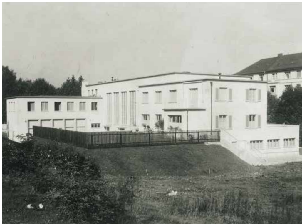
Zwinglihaus vor der Eröffnung 1932, Blick von Südosten